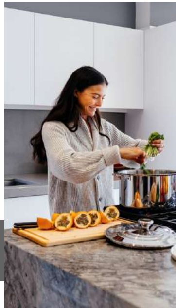
Compra todo fresco del mercado