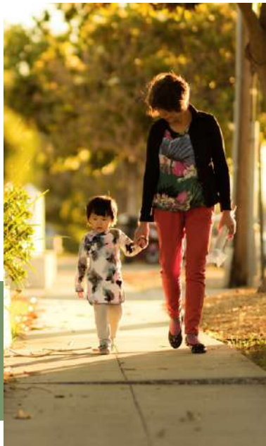
Pasea con tranquilidad