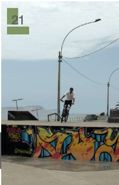
Haz deporte al aire libre